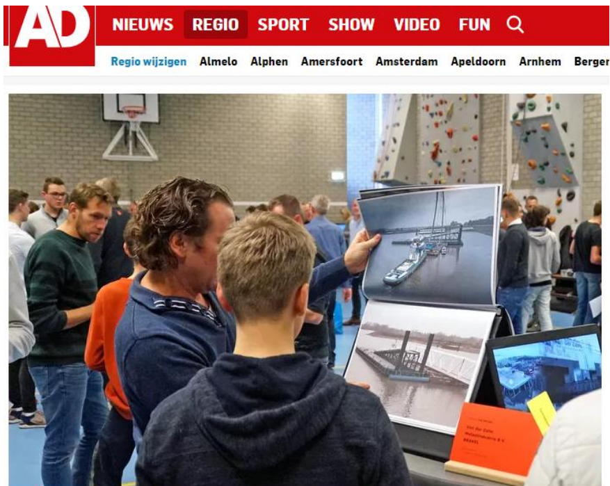
▲ Een stagemarkt op het Gilde Vakcollege in Gorinchem.